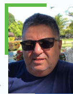
Por Fernando Brito PT7FB/PR8KT

E m um mundo cada vez mais dependente de tecnologias complexas e redes digitais, o radioamadorismo permanece como uma atividade essencial — não apenas como passatempo, mas como ferramenta estratégica de comunicação, aprendizado e, sobretudo, de solidariedade. Celebrado em 18 de abril, o Dia Mundial do Radioamadorismo convida a sociedade a olhar com mais atenção para esse universo muitas vezes silencioso, mas extremamente ativo. Por trás de cada estação, há operadores capacitados que dominam conhecimentos técnicos em eletrônica, propagação de sinais e operação do espectro radioelétrico. Trata-se de uma prática que estimula o desenvolvimento científico e o aprimoramento contínuo de habilidades, formando verdadeiros especialistas em comunicação.